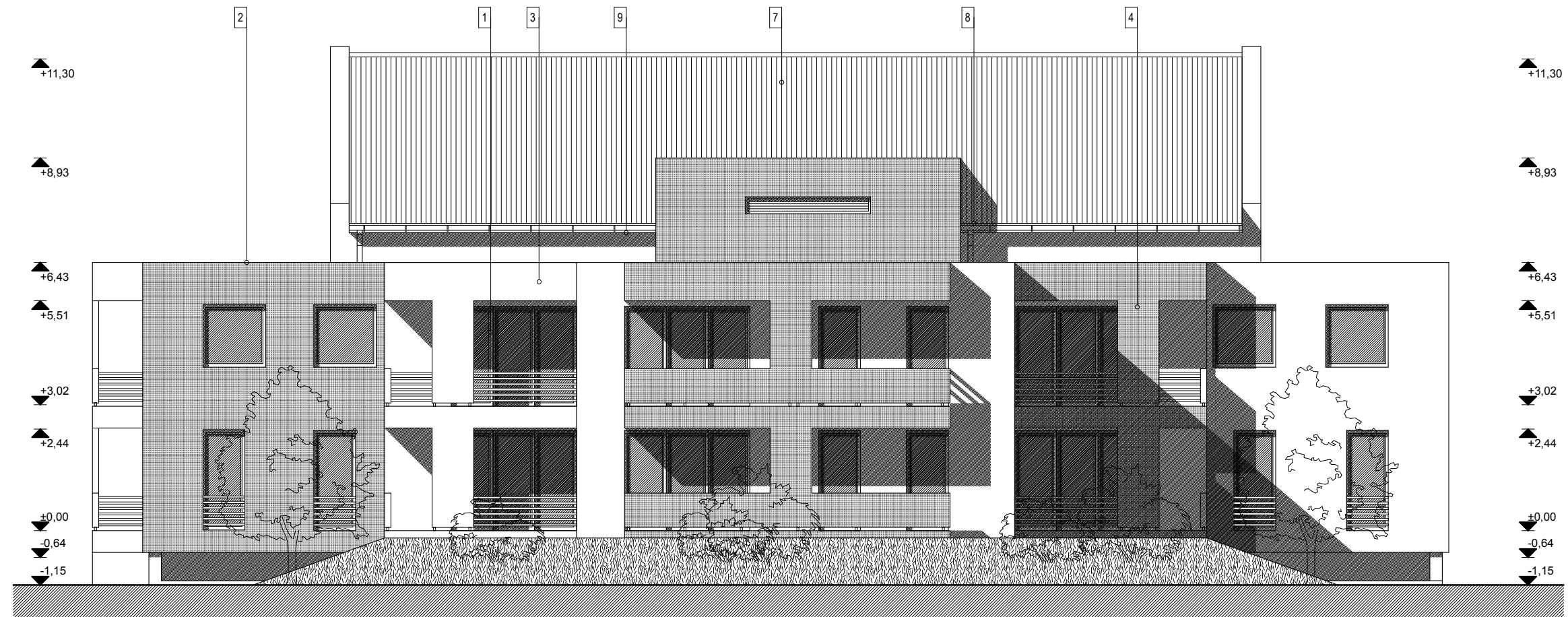
NYUGATI HOMLOKZAT M =1:100